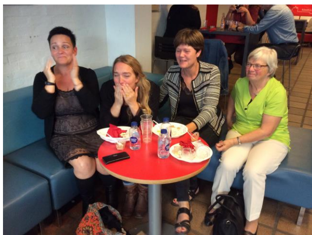
Home-Start Nordvestsjælland svar på Spice Girls til Frivillig fredag i Kalundborg

Vi har været til folkemøde i Høng, lavet oplæg om småbørnsfamilier i Sdr. Jernløse kirke, undervist på UCC Absalon, deltaget i et solfyldt Te selskab på Holbæk museum, haft stand på Erhvervsmessen I Kalundborg og været til Frivillig fredag i Kalundborg.