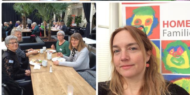
Mange fra afdelingen deltog i Home-Start Danmarks landsmøde i Vejle.

2017 blev skudt i gang med et fantastisk Landsmøde, hvor vi fik mulighed for at møde Home-Start folk fra hele landet. Svend Åge Madsen satte farrollen i fokus med et spændende og relevant oplæg.